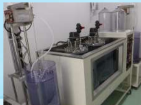
嫌気性消化実験 (連続式)