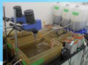
生物処理試験 (連続式)