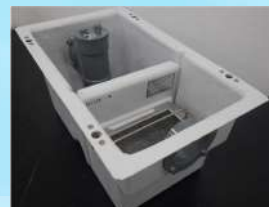
油分除去試験 (クリストフ)