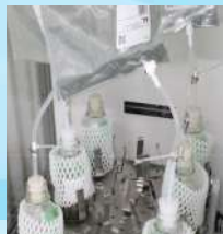
回分式試験 (嫌気性消化)