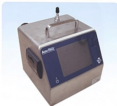
ニッタ株式会社製 ポータブル気中パーティクルカウンター